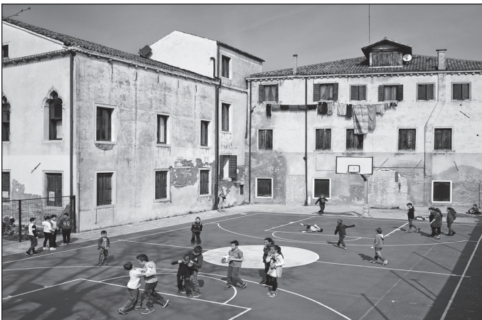
Doc. 3 École Ugo Foscolo, Murano, Venise (Italie).