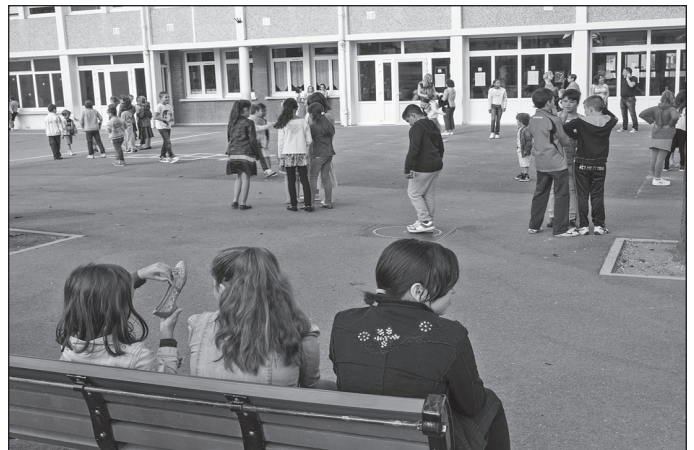
Doc. 4 École Paul Langevin, La Courneuve (France).