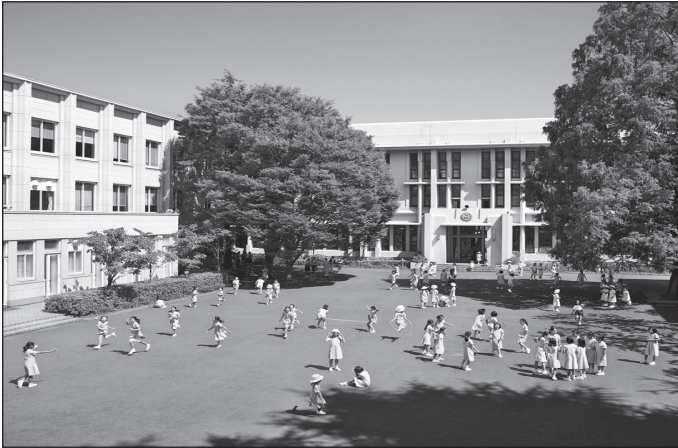
Doc. 1 École Seishin Joshi Gakuin, Tokyo (Japon).

1. Décris, sous chaque photo, chacune de ces cours de récréation en te posant les questions du géographe : où ? qui ? quoi ? pourquoi ? pour qui ? comment ?